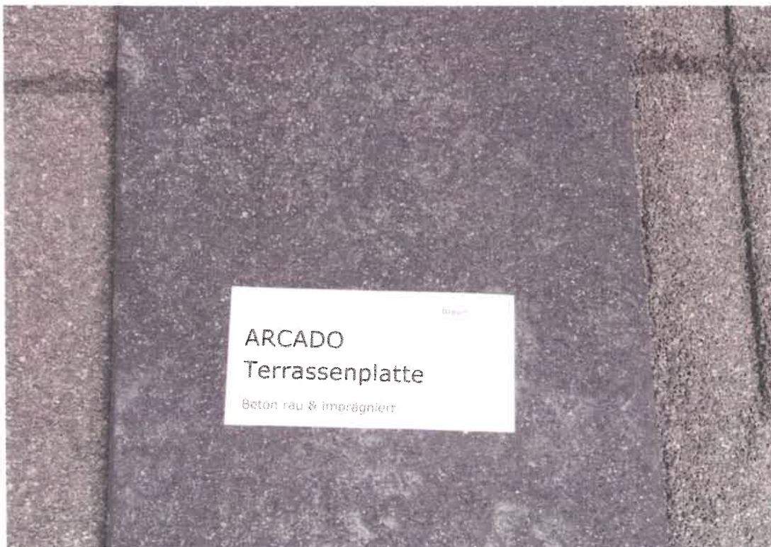
Bild 1. Die zu prüfende Oberfläche ARCADO Terrassenplatte, betonrau, hydrophobiert im aufgebauten Zustand.